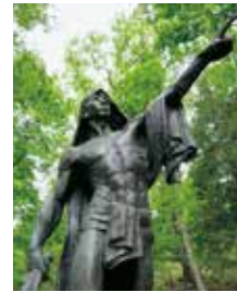
48 建国の雄姿 1926年

北村西望は明治17年(1884)長崎県南高来郡島原半島南部)生まれ。十代に彫塑を志し以来80余年帝展(文展)・日展作家として活躍しました。昭和30年(1955)には有名な「長崎平和祈念像」を製作し、昭和33年(1958)に文化勲章・文化功労者を受章。百歳を超えてもなお創作活動に励み、昭和62年(1987)500以上の膨大な作品を残し、人々に惜しまれながら102歳の生涯を閉じました。