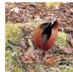
雪解けとともに咲くザゼンソウ