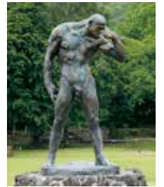
26 創造の人 1927年