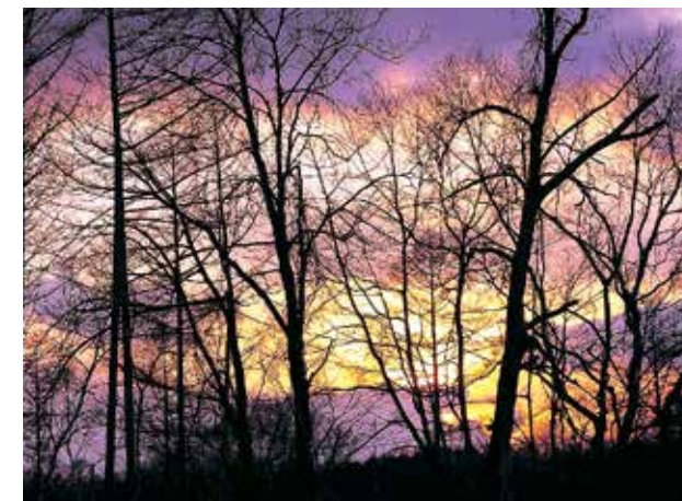
彫刻公園の夕暮れ

●営業時間 9:00~18:00 https://resort-hotel-tateshina.jp