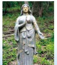
65 戦災者慰霊の女神 1975年