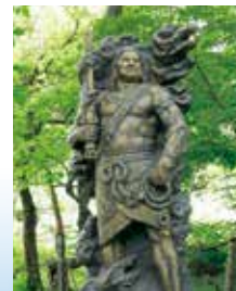
45 不動明王 1975年