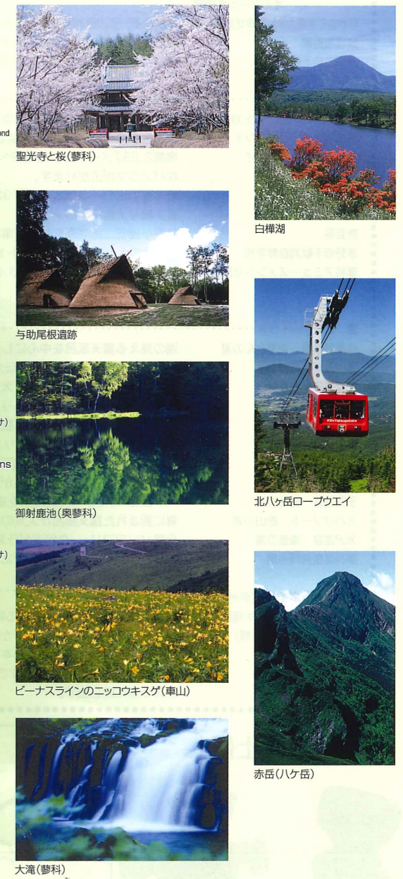
聖光寺と桜(茅科) 白樺湖 与助尾根遺跡 北八ヶ岳ロープウェイ 御射鹿池(奥茅科) ピーナスラインのニッコウキスゲ(車山) 大滝(茅科) 赤岳(八ヶ岳)